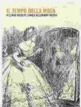
Evans e Vaccari IL TEMPO DELLA MODA Mimesis, 218 pag., 20 euro

Come pochi altri fenomeni, la moda crea e misura i propri tempi. A cura di Caroline Evans e Alessandra Vaccari, "Il tempo della moda" mette insieme i testi chiave sulla materia dall'800 a oggi, con un approccio interdisciplinare che va dalla filosofia alla storia, dai media al design. Ricca è la varietà delle fonti: libri e cataloghi di mostre, articoli scientifici e giornalistici, interviste e autobiografie.